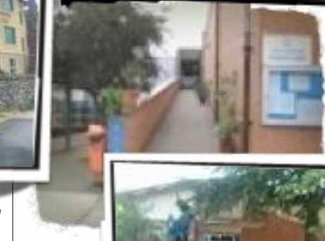
Scuola Primaria " Edmondo De Amicis " Via Tevere - tel. 0572 74653