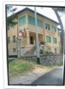
Scuola Primaria " Renato Fucini " Località "Nievole" Via Sano, 12 tel. 0572 67093