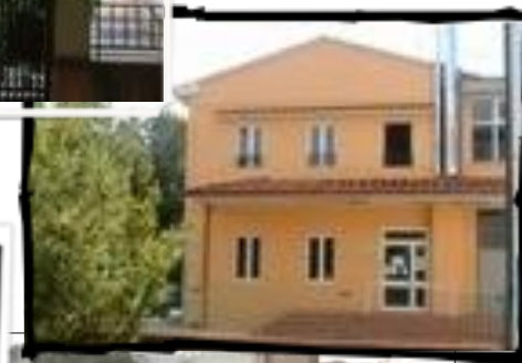
Scuola Primaria " Don Giulio Facibeni " Via Lucchese - tel. 0572 910970